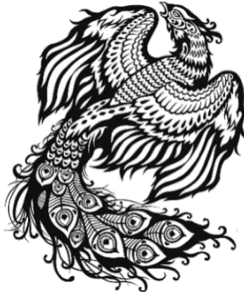
주작 남쪽을 지키는