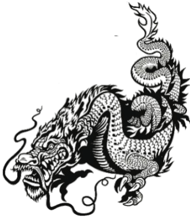
청룡 서쪽을 지키는