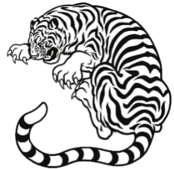
백호 동쪽을 지키는