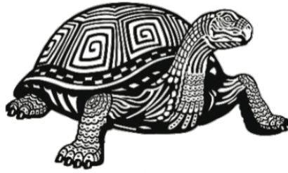
현무 북쪽을 지키는