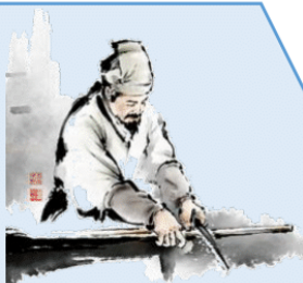
조선의 위대한 발명가 장영실