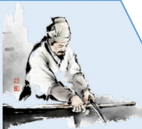
조선의 위대한 발명가