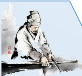
조선의 위대한 발명가 장영실