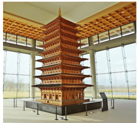
황룡사 9층 목탑 복원본

황룡사 9층 목탑 은 선덕여왕이 주변 나라들의 침략을 막아내고 나라를 통일하고 싶은 소망을 담아 만들었어요. 그래서 1층은 일본 , 2층은 중화 , 3층은 오월 , 4층은 탁라 , 5층은 응유 , 6층은 말갈 , 7층은 단국 , 8층은 여적 , 9층은 예맥 이라고 주변 나라들의 이름을 새겨 넣었어요. 이렇게 높고 멋진 탑을 만들어 여왕이라고 주변 나라에서 무시하지 못하도록 하고, 신라인들의 자긍심 을 높였답니다.