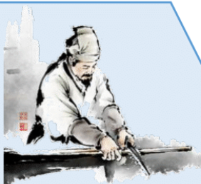
조선의 위대한 발명가 장영실