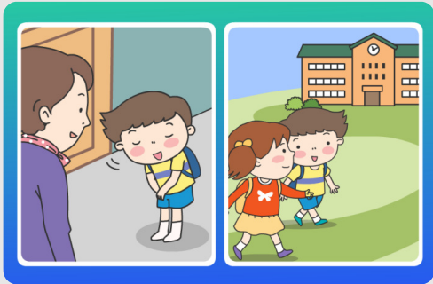
학교에 가기 전에 인사해요.