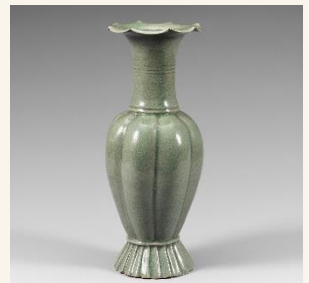
순청자 참외 모양 꽃병