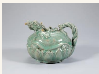
청자 구룡형 주전자