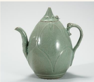
청자 죽순모양 주전자