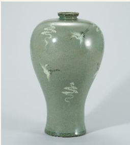
청자 상감 구름 학무늬 매병

2 다양한 고려청자 사진을 보세요. 어떤 고려청자가 가장 마음에 들어요? 여러 고려청자를 어디에 사용했을까요? 어떤 고려청자가 가장 마음에 들어요?