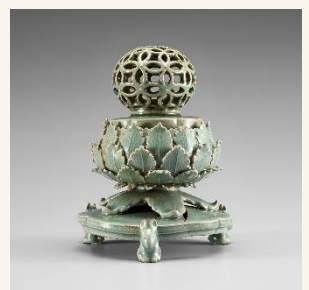
청자 투각 칠보무늬 향로