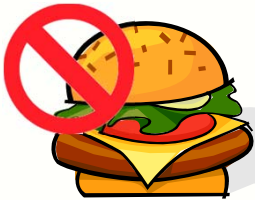
음식을 먹지 마십시오

‘-지 말다’의 활용형은 주로 상대방에게 명령형이나 청유형으로 쓰이기 때문에 구어로 하는 대화 상황에서 쓰인다. 또한 영화관이나 학교 건물, 병원과 같은 공공장소에서 여러 사람들에게 금지하는 사항을 알리기 위해서 그림이나 표어로 쓰인 것을 볼 수 있다.