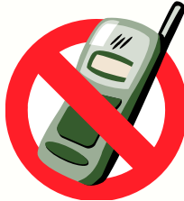
휴대전화를 사용하지 마십시오