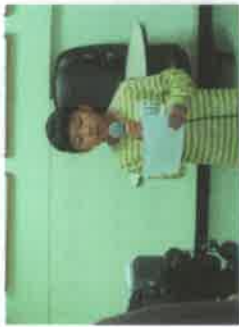
독서 방송 장면