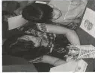
학습 활동 장면