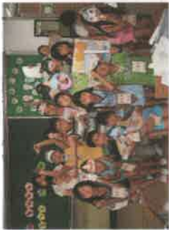
정독 도서관 연계 활동