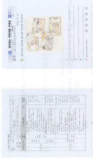
통합 논술 수업 과정안 논술 수업 자료