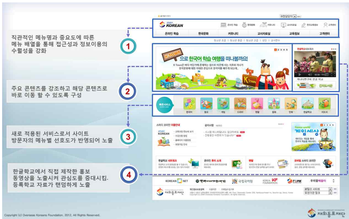
그림 1. 스터디코리안 사이트 첫 화면

스터디코리안은 코리안넷에서 가입한 아이디로 접속할 수 있다. 스터디코리안의 첫 화면은 주요 콘텐츠와 메뉴를 직관적으로 배열하여 정보에 접근하기 쉽게 하였다. 그리고 한글학교에서 제작한 홍보 동영상을 메인 화면에 노출시켜 한글학교에 대한 관심을 끌 수 있게 하였으며, 이외에도 전 세계 한글학교 간 유대 관계를 형성할 수 있는 콘텐츠를 제공하고 있다.