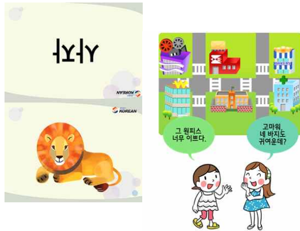
그림 6. 교사용 콘텐츠 - 멀티미디어 자료