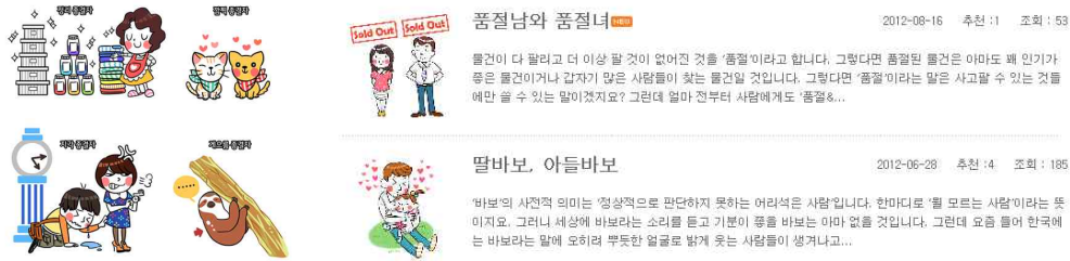
그림 4. <주간 한국어 학습>의 예

삽화가 있는 회화와 칼럼을 통해 일상회화, 관용표현, 사자성어, 유행어 및 신조어를 학습할 수 있는 콘텐츠이다. 격주마다 뉴스레터로 제공된다.