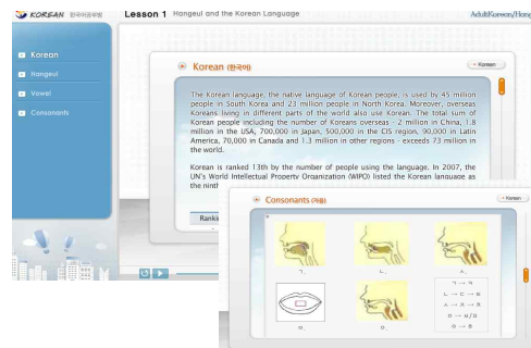
그림 3. 성인 학습 콘텐츠 1차시 <한글 및 한국어>

재외동포재단이 재외동포 성인을 대상으로 개발한 초급 단계 온라인 한국어 학습 콘텐츠로 한글 입문과 기초회화로 구성되어 있다. 총 35차시로 각 차시에서 대화, 토론, 어휘, 표현, 쓰기 등 다양한 활용이 가능하다.