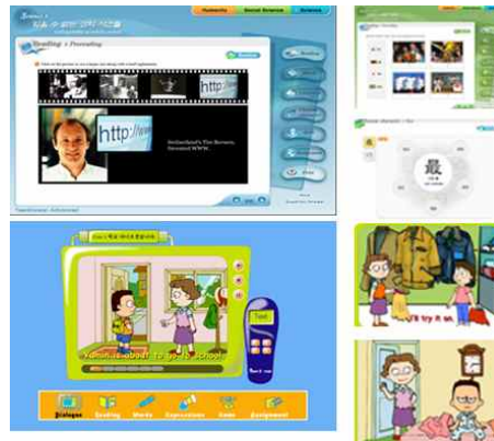
그림 2. 틴코리안 과정 화면